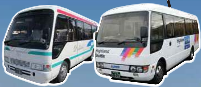
相互第一交通、アルピコタクシーのマイクロバスが運行します