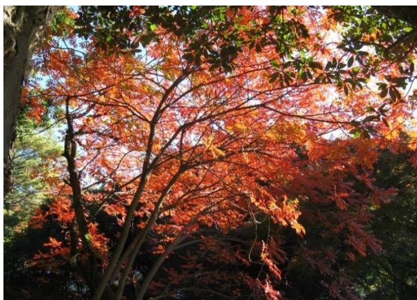
六義園：ナナカマドの紅葉