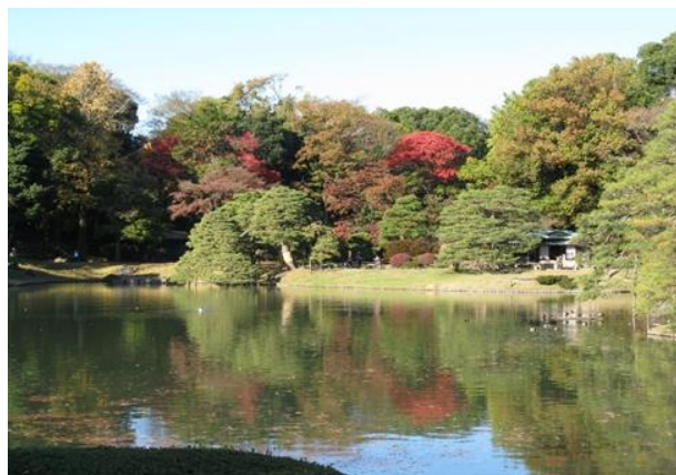
六義園：池に映える緑と赤