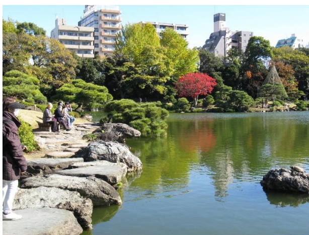
清澄庭園：磯渡り (右の岩上に亀)