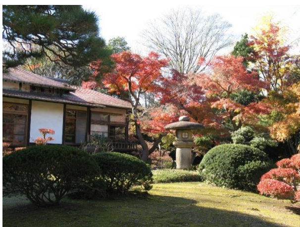
小石川後樂園：涵徳亭