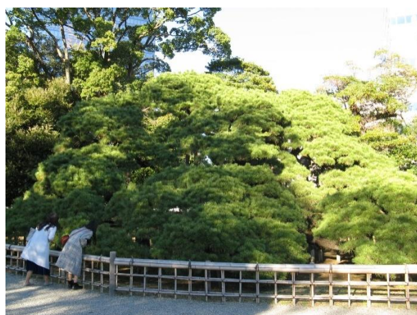
浜離宮庭園：「五百年の松」